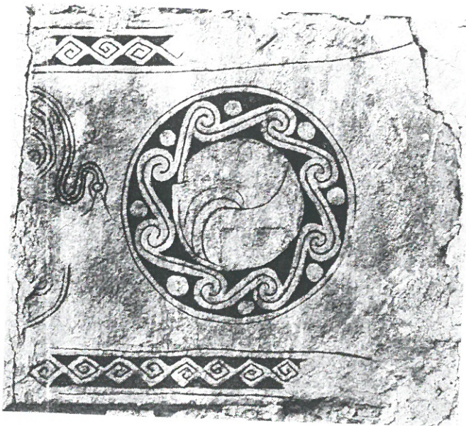
Bild 2. Bildstenfragment inmuret i Bro kyrkas östra långhusgavel.

andra rankans våglinje till en sickacklinje; samtidigt förvandlades stjälkarnas spiraler till de kompakta krokar, vi här se. På vissa andra bildstenar äro rankorna lättare att känna igen.